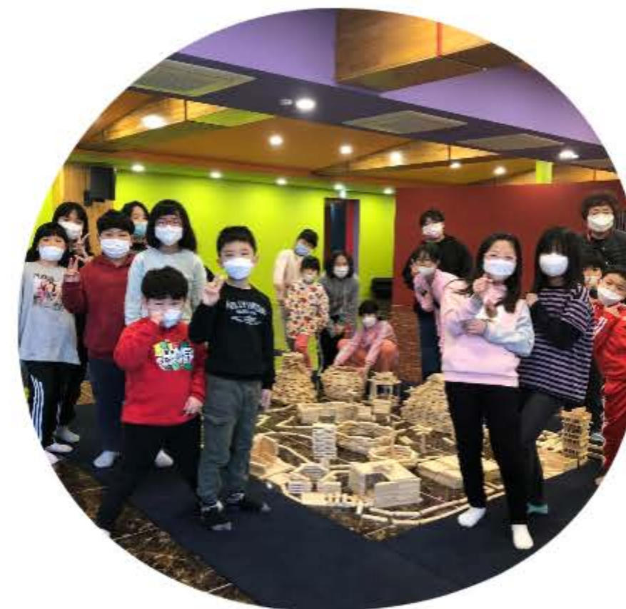
편백 힐링 카프라

편백나무칩(카프라)를 활용한 소근육 운동으로 촉감자극 및 공동체의식 함양 프로그램