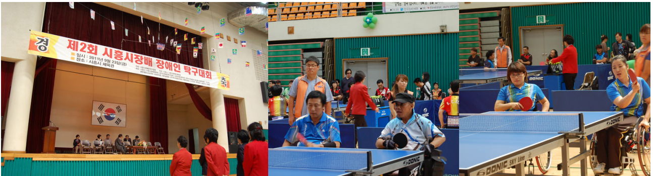
제2회 시흥시장배 장애인탁구클럽 good match 2011. 9. 23(금) 시흥시체육관