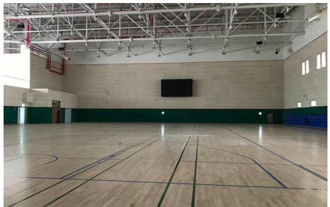
시흥어울림국민체육센터 4층 대회장