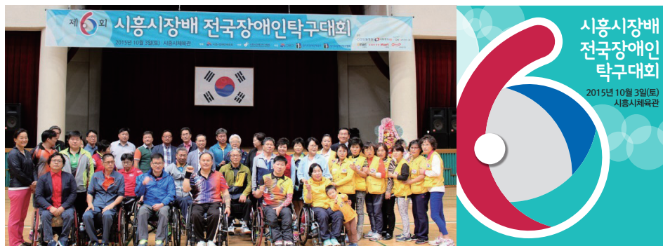
제6회 시흥시장배 전국장애인탁구대회 2015. 10. 3(토) 시흥시체육관