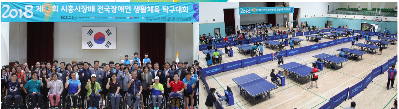
제9회 시흥시장배 전국장애인 생활체육 탁구대회 2018. 7. 7(토) 시흥시체육관