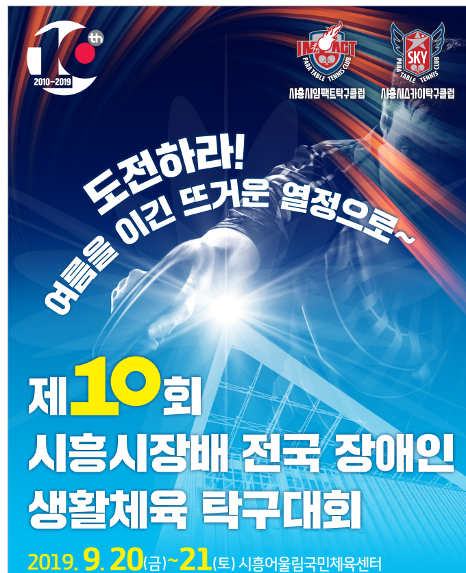
제10회 시흥시장배 전국장애인 생활체육 탁구대회 2019. 9. 20(금)~21(토) 시흥어울림국민체육센터