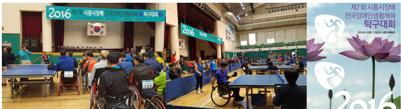
제7회 시흥시장배 전국장애인 생활체육 탁구대회 2016. 10. 15(토) 시흥시체육관