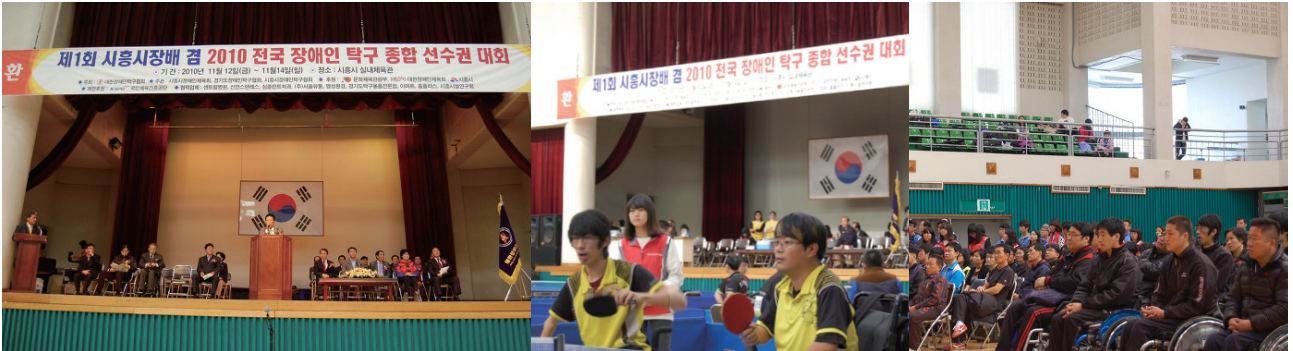
제1회 시흥시장배 겸 2010 전국 장애인종합선수권대회 2010. 11. 12(금)~14(일) 시흥시체육관