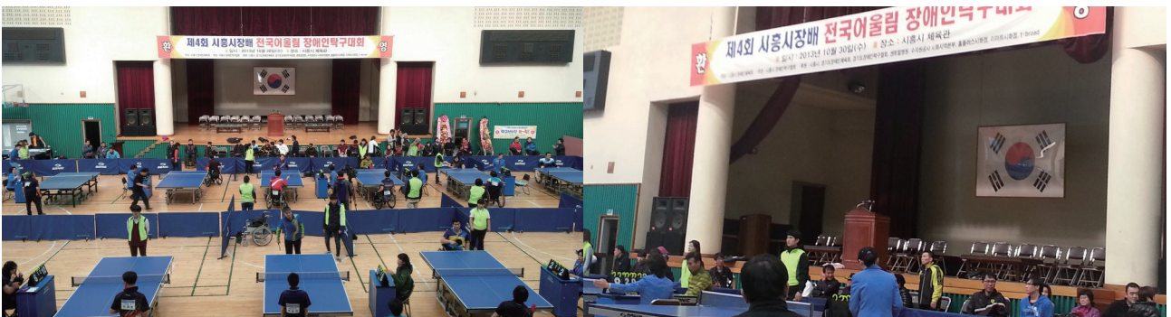
제4회 시흥시장배 전국어울림 장애인탁구대회 2013. 10. 30(수) 시흥시체육관