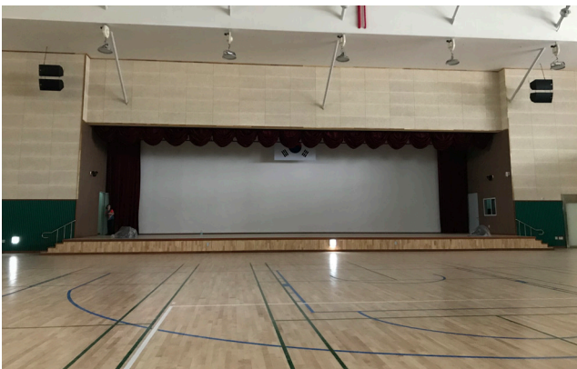
시흥어울림국민체육센터 4층 대회장