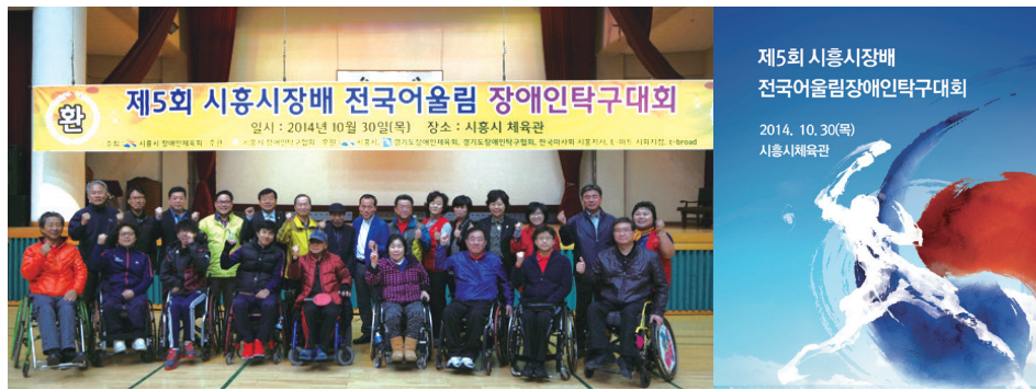
제5회 시흥시장배 전국어울림 장애인탁구대회 2014. 10. 30(목) 시흥시체육관