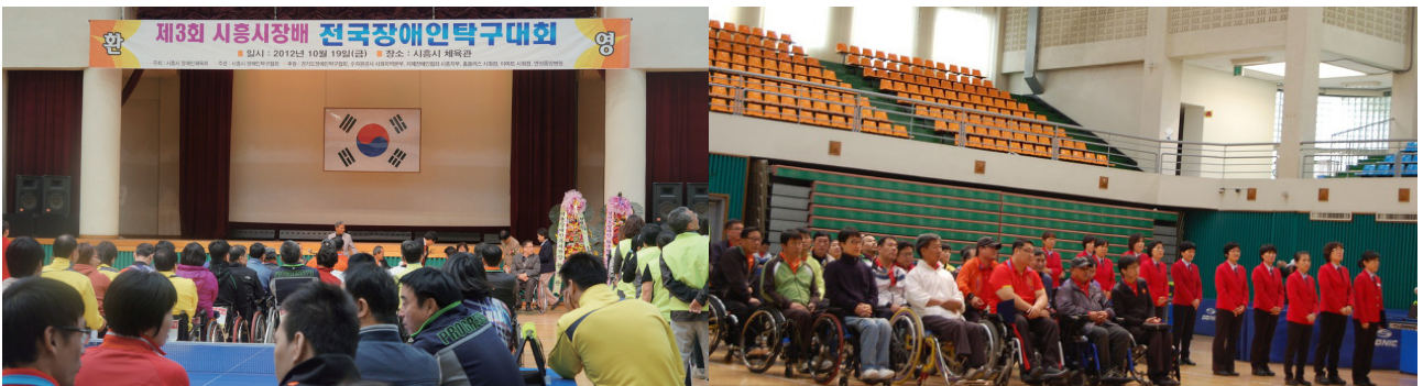
제3회 시흥시장배 전국장애인탁구대회 2012. 10. 19(금) 시흥시체육관