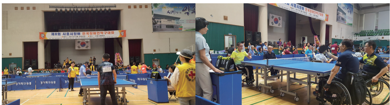
제8회 시흥시장배 전국장애인탁구대회 2017. 6. 30(금) 시흥시체육관